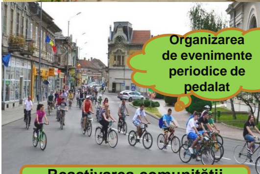
Organizarea de evenimente periodice de pedalat