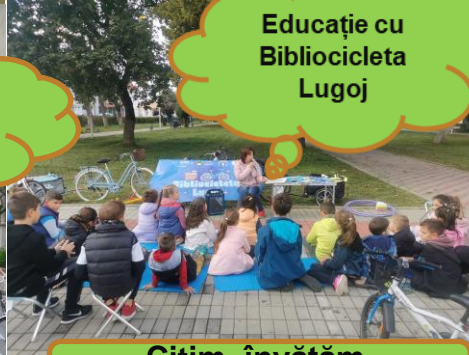
Educație cu Bibliocicleta Lugoj