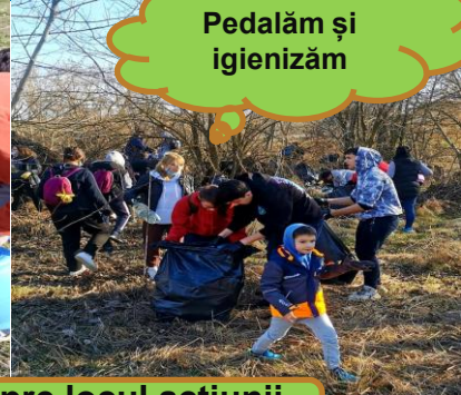
Pedalăm și igienizăm