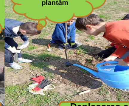
Pedalăm și plantăm